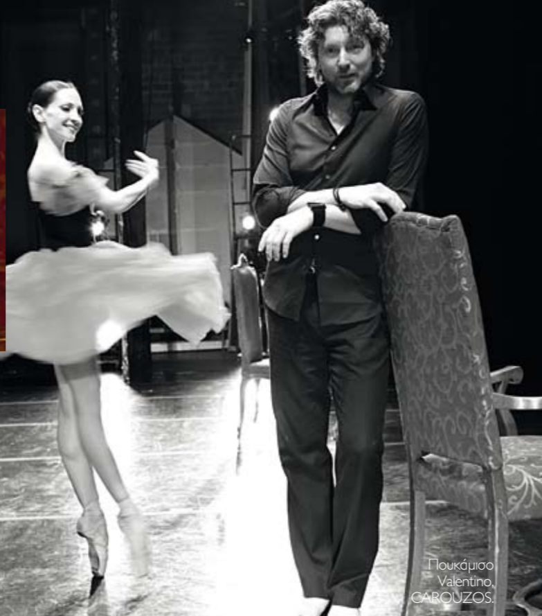
Πουκάμισο Valentino, CAROUZOS.

«Βάλε στόχο το φεγγάρι, κι αν τυχόν αβτοχήσεις, ίσως πετύχεις κανένα αβτέρι».